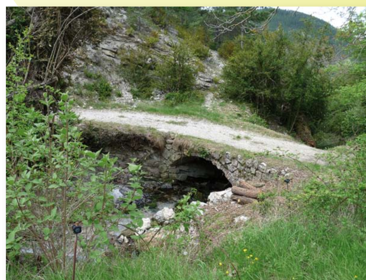
Le premier pont