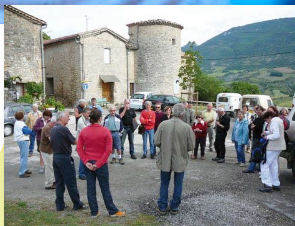
Rassemblement matinal à St Auban